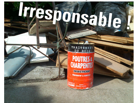
Un bidon au quart plein de produits toxiques, laissé ouvert près de l'ère de jeu des enfants.