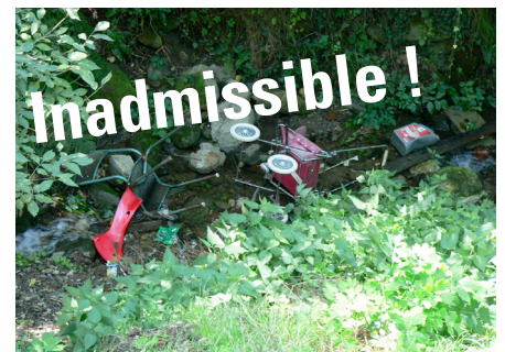
Le Val Panera n'est pas une poubelle, c'est un lieu qu'il faut protéger