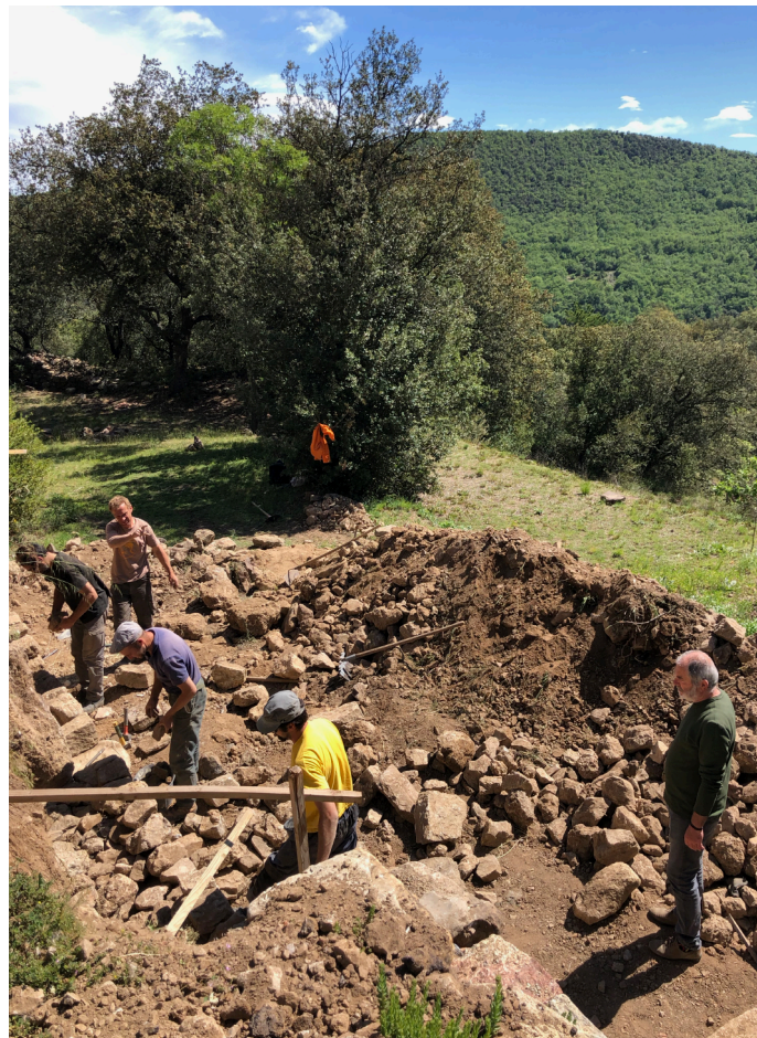
Les ouvriers de la « Pierre Catalane » à l'œuvre. Ci-dessous, le merveilleux résultat du mur reconstitué, agrémenté d'une niche mettant en valeur deux pierres : l'une, en bas, trouvée dans l'ébouli, l'autre, au fond de la niche, incluse dans la terre du remblai.

Il fera l'objet d'une journée citoyenne de nettoyage et de réhabilitation de la source de la « Fount envoad » à l'automne, qui se terminera par une inauguration et une grillade conviviale. Nous comptons sur votre présence ! ■